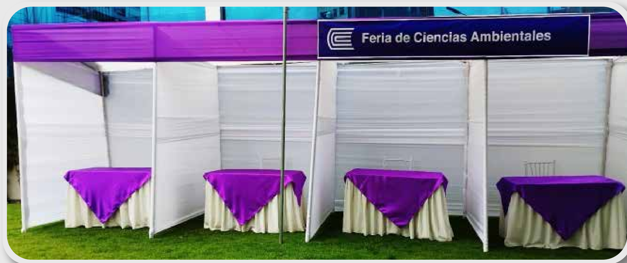
*Foto de referencia stands.